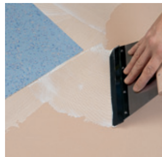
5. Všetky podlahové krytiny ako PVC, koberce, linoleum atď. nalepte s Špeciálne lepidlo do adhézneho lôžka LF 300