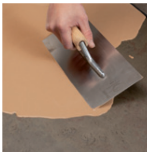
3. Na pripravený podklad nalejte rýchlu nivelačnú hmotu SL 52 pokiaľ možno v jednom pracovnom kroku v požadovanej hrúbke vrstvy (max. 20 mm) a rovnomerne rozotrite stierkou.