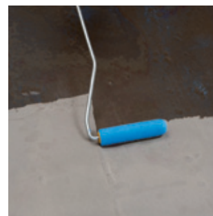
2. Nasiakavý podklad rovnomerne napenetríte s Hĺbkový základ D7