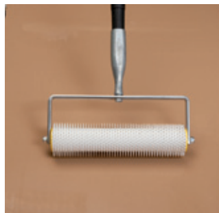
4. Čerstvú nivelačnú hmotu ešte pred vytuhnutím, odvdzdušnite pomocou prevzdušňovacieho valca.