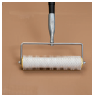
4. Čerstvú nivelačnú hmotu ešte pred vytužnutím, odzdušnite pomocou prevzdušňovacieho valca.