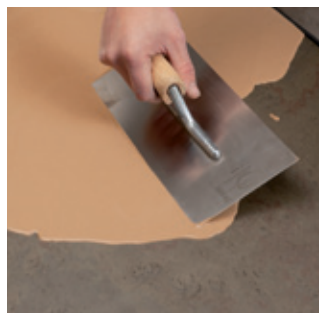
3. Na pripravený podklad nalejte rýchlu nivelačnú hmotu SL 52 pokiaľ možno v jednom pracovnom kroku v požadovanej hrúbke vrstvy (max. hrúbka = 20 mm) a rovnomerne rozotrite stierkou.