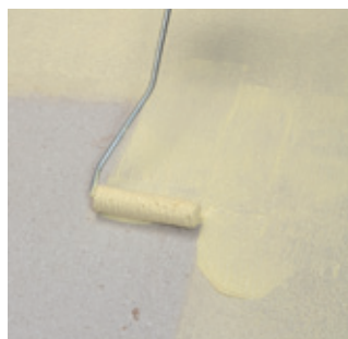
1. Nenasiakavý podklad rovnomerne napenetríte s Superzáklad D4