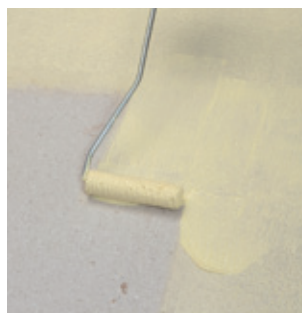
1. Nenasiakavý podklad rovnomerne napenetríte s Superzáklad D4