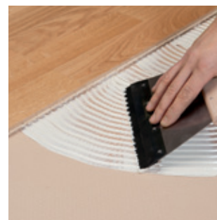
5. Všetky druhy parkiet a dreva nalepte s X-Bond MS-K 88